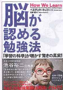
『脳が認める勉強法 「学習の科学」が明かす驚きの真実!』 ベネディクト・キャリー 著 花塚 恵 訳 (ダイヤモンド社 1800円)

「 フツターの会社員だった僕が、青山学院大学を箱根駅伝優勝に導いた47の言葉 」は、指導革命によって大学駅伝に新時代をもたらした著者の持論。評論家ではなくプレーヤーとして現実を動かした人ならではの迫力に満ちている。リーダーシップ論や組織論としても面白いが、ピーキング理論など、負事である受験を勝ち抜くにも、参考になる視点を得られる。