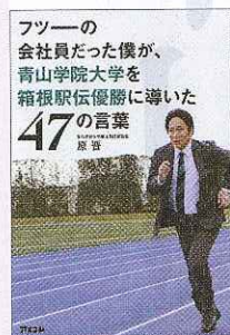
『フツターの会社員だった僕が、 青山学院大学を箱根駅伝優勝に導いた47の言葉』 原 晋 著 (アスコム 1300円)