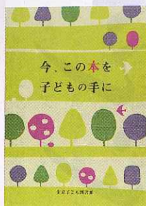
「今、この本を子どもの手に」 東京子ども図書館 編 (東京子ども図書館 1000円)

「 学校と一緒に安心して子どもを育てる本 」は、小学校教育一筋の先生の著書。教育は、誰でも何かを語れる。百花繚乱さまざまな書籍が出版されている一方、気になることがある。スポットが当たるのは、わが子の入試で結果を出した親の体験記や、華々しい成績アップを成し遂げた塾や先生の持論、評論家や学者先生の大所高所からのデータを基にした本ばかりで、