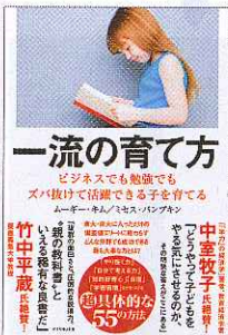
「一流の育て方」 ムーギー・キム、 ミセス・パンブキン 著 (ダイヤモンド社 1600円)