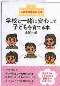
「学校と一緒に安心して子どもを育てる本」 多賀一郎 著 (小学館 1100円)