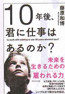
『10年後、君に仕事はあるのか?』 藤原和博 著 (ダイヤモンド社 1400円)