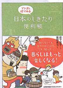
『マンガと絵でみる日本のしきたり便利帳』 高田真弓 著 (日本能率協会マネジメントセンター 1300円)